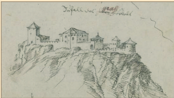
La più antica mappa dei castelli dell'Alto Adige (volume 1)