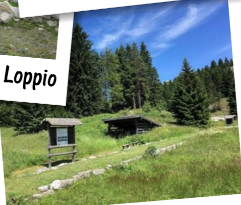
Giardino Botanico Passo Coe