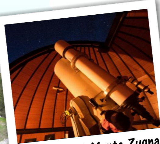
Telescopi di Monte Zugna