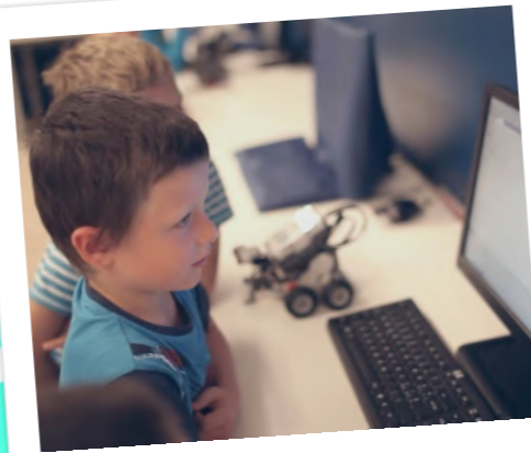
Laboratori di robotica