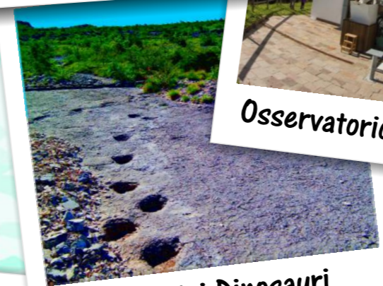
Orme dei Dinosauri