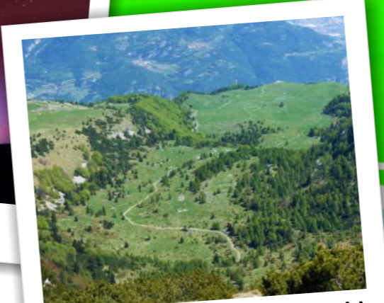
Alla scoperta del Monte Baldo