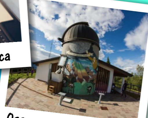
Osservatorio Monte Zugna