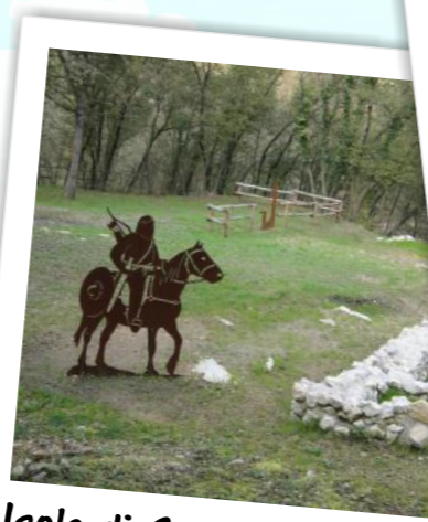
Isola di Sant'Andrea a Loppio

giovedì 5 luglio, ore 10 | Conoscere gli abitanti del giardino giovedì 12 luglio, ore 10 | Riconoscere le piante mangerecce giovedì 19 luglio, ore 10 | Leggere le rocce giovedì 2 agosto, ore 10 | Riconoscere le piante mangerecce giovedì 9 agosto, ore 10 | Conoscere gli abitanti del giardino giovedì 16 agosto, ore 21 | Osservare il cielo giovedì 23 agosto, ore 10 | Leggere le rocce