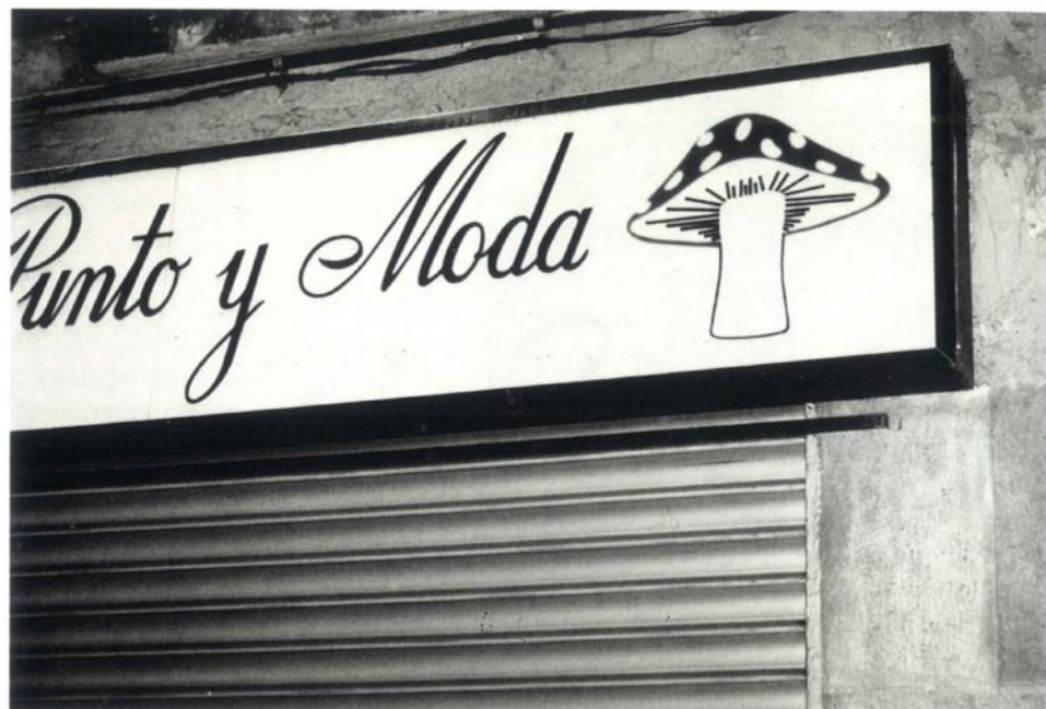
Fig. 3 - Cartel de anuncio de un comercio céntrico de Barcelona, situado en el casco antiguo de la ciudad. El rótulo tiene 10 años de antigüedad como máximo. El comercio vende ropa.