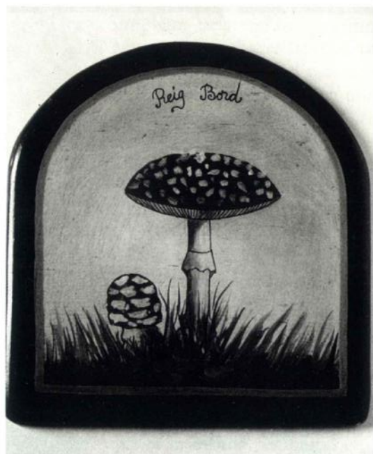
Fig. 4 - Imitación de pintura antigua representando en estilo naturalista una Am. Muscaria. En la parte superior está escrito el nombre popular catalán «Reig Bord» Mide 19 cm. de alto x 18 cm. de ancho. Adquirido en la feria de Navidad de Barcelona.