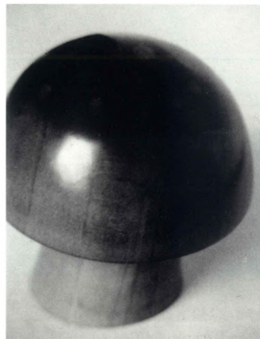
Fig. 9 - Reproducción pulida de Am. Muscaria en madera noble. Mide 8 cm. de alto x 6'8 de diámetro. Adquirido en un comercio de objetos de decoración lujosos.