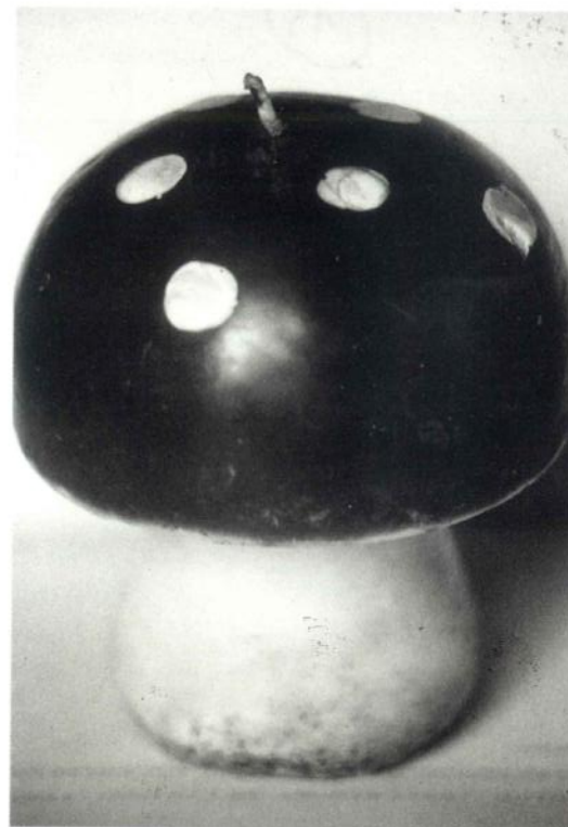
Fig. 1 - Vela de cera. Las fabrican en diversos tamaños. Adquirida en Barcelona. Mide 10 cm. de alto x 7'5 cm. de diámetro.

Es muy distinto en la actualidad decir a alguna persona, por ejemplo, que «está borracha», «está drogada», o «es demente». Estas expresiones también se refieren a un comportamiento anormal, pero a diferencia de estar tocat del bolet, son agresivas, insultantes y ofensivas. Otras expresiones de sentido similar son «estar loco» o «estar chiflado», que aunque no tienen el carácter ofensivo de las anteriores, tampoco tienen el contenido semántico de simpatía y complicidad de «estar tocado por el hongo». Así pues, la expresión «estar tocado por el hongo» no es algo sobre lo que hacer preguntas, sino que es la misma respuesta.