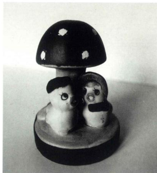
Fig. 6 - Figura infantil representando dos pequeños patos refugiados bajo una Am. Muscaria. Mide 9'2 cm. de alto. Está fabricado en China y se distribuyen en el sur de Francia y en Cataluña.