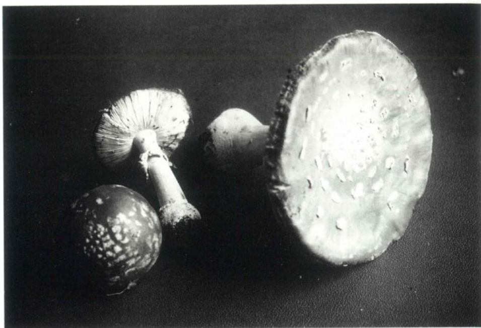
Fig. 11 - Ejemplares de Am. Muscaria recogidos en la zona de Olot (Cataluña), en un bosque de abedules. Tamaño medio.