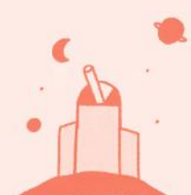
Osservatorio astronomico di Monte Zugna