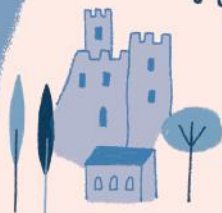
Castello di Avio